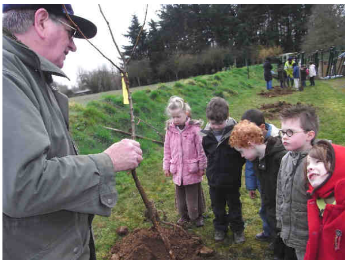
Le lundi 21 février les enfants ont participé à la plantation d'arbres au verger de l'école