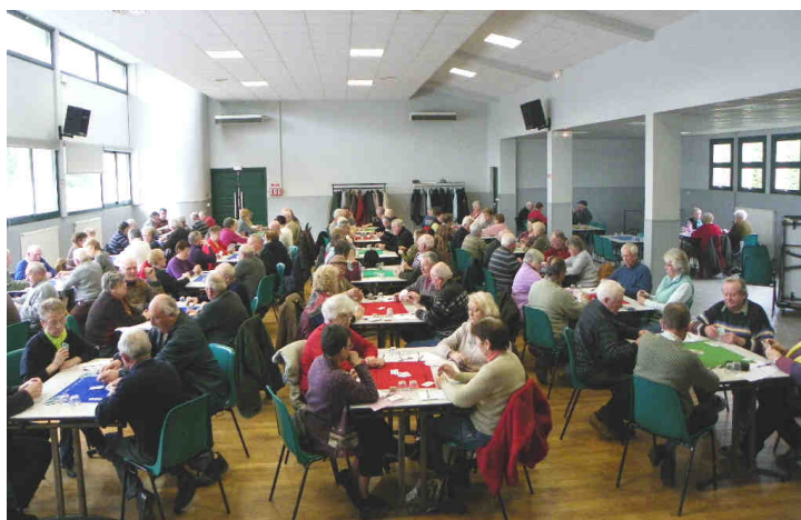
Concours de belote du Club de l'Amitié du mardi 22 février