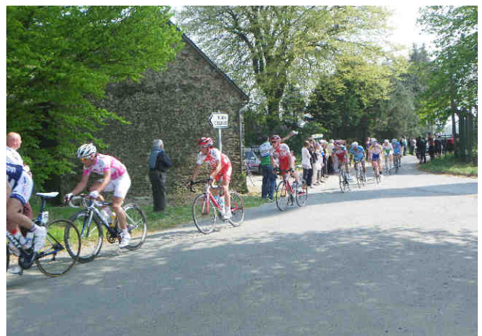
Lundi 25 avril, passage du circuit du Mené au col du Mont Bel Air