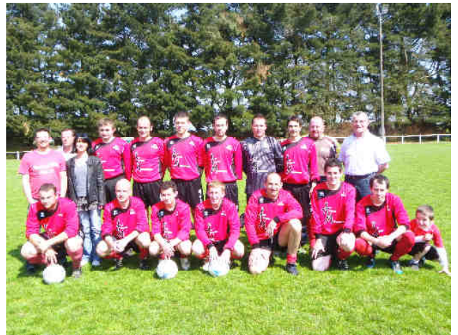
AST Dimanche 17 avril, les joueurs de l'équipe A ont reçu un jeu de maillot (rouge) offert par l'entreprise locale « Astuces Menuiseries » qui a également remis des sweats noirs pour tous les joueurs du club de foot