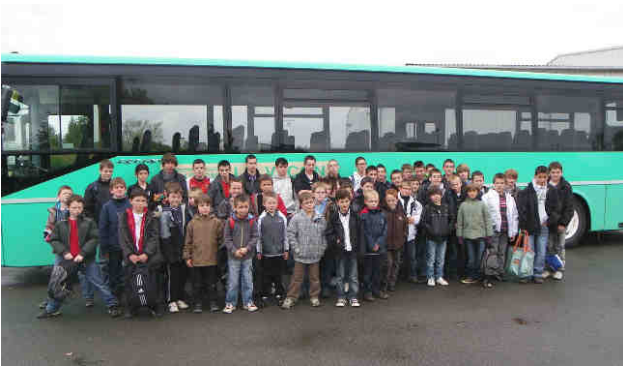
Ecole de foot « Entente Mené Guessant » Samedi 2 avril, 60 enfants de l'école de foot accompagnés de 20 adultes (éducateurs et bénévoles) ont pris le car, direction le stade Rennais pour assister au match Rennes-Auxerre