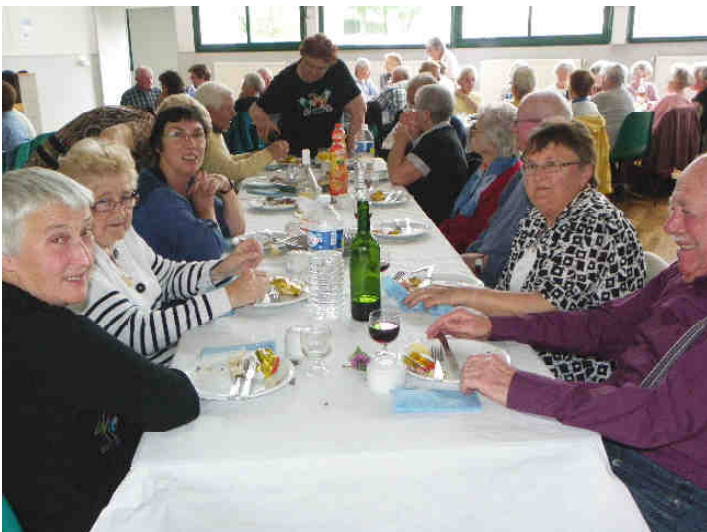
Jeudi 21 avril, le club de l'Amitié a savouré la potée