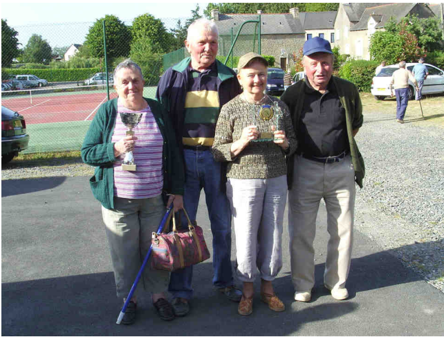
Les finalistes du concours de boules du club de l'Amitié du mardi 24 mai