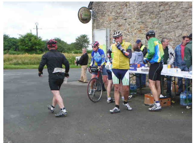
Passage de la Bernard Hinault au col du Mont Bel Air