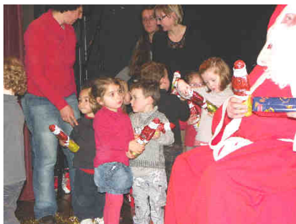
Soirée de Noël des enfants du RPI St Glen Trébry du vendredi 16 décembre