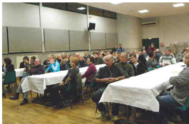
Assemblée Générale du comité des fêtes du vendredi 9 décembre