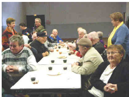
Club de l'Amitié Assemblée Générale et dégustation de la bûche de Noël du jeudi 15 décembre