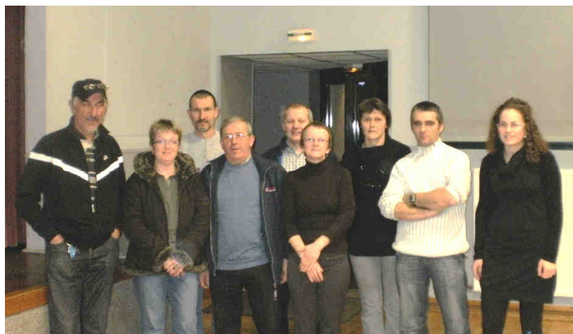
Assemblée générale du comité des fêtes du vendredi 10 décembre