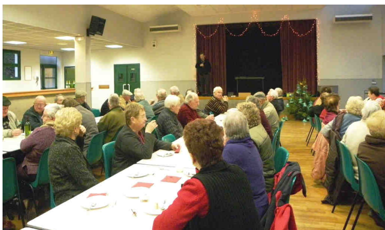
Club de l'Amitié : A.G et dégustation de la bûche de Noël du jeudi 16 décembre