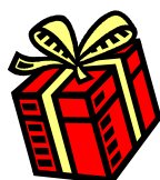
Gôûter de Noël de l'école avec la visite du Père Noël